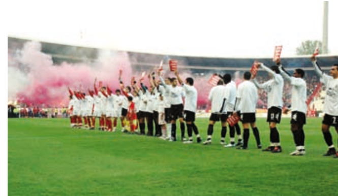
Red Star Belgrade