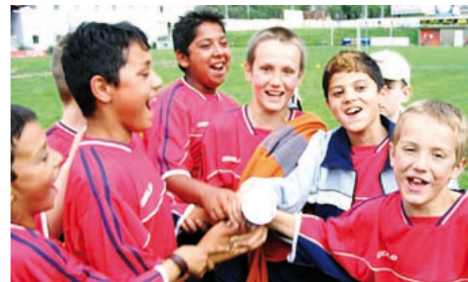
Ludis Proti Rasizmu

Запланированные на время чемпионата мероприятия пройдут под лозунгом «Вместе против расизма» и затронут каждый матч финальной стадии. Для пропаганды идей антирасизма в Австрии и Швейцарии будут выделены отдельные рекламные