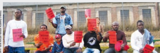
MFAC - New African Football Academy (Yemen)

Ссылка: http://www.eglsf.info/ Контакт: fare@eglsf.org