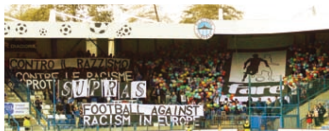
Fan project Slovak Liberec

Руководящий орган европейского футбола УЕФА установил тесные связи с сетью FARE. Вы найдёте дополнительную информацию об антирасизме, а также все новости футбола по этой ссылке: http://ru.uefa.com/uefa/keytopics/kind=2/index.html