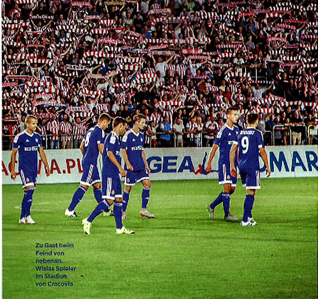
Zu Gast beim Feind von nebenan. Wislas Spieler im Stadion von Cracovia

Doch anderthalb Stunden vor dem Anpfiff im Sommer 2015 gibt es mehr Bambini als Bambule, herrscht osteuropäisches Urlaubsflair mit Kindern in kurzen Hosen und vor Mayonnaise triefenden Broten. Die Fußballinfrastruktur im ehemaligen Ostblock ist ein guter Gradmesser für den Zustand der Gesellschaft. Sozial fortschrittliche Länder haben unscheinbare Stadien, weil sie keine Spielwiesen von Oligarchen sind, die von Moskau bis Donesk Fünf-Sterne-Paläste hochgezogen haben. Die schmucklose Arena von Cracovia wurde vor sechs Jahren neu errichtet, fasst übersichtliche 15 000 Menschen und ist dem Zeitgeist entsprechend eine Einkaufspassage mit angeschlossenen Spielbetrieb. Die Schaufenster werden dieses Spiel am zweiten Spieltag der polnischen Ekstraklasa überstehen, auch weil keine