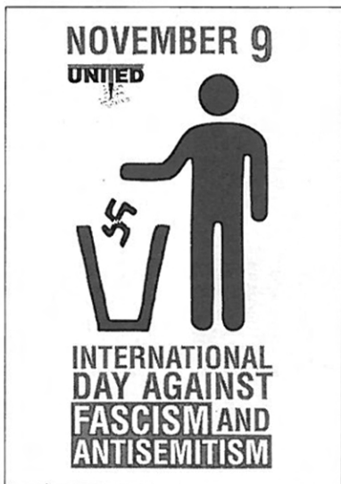
Logo Międzynarodowego Dnia Walki z Faszyzmem i Antysemityzmem – co roku 9 listopada jego obchody w Europie koordynuje UNITED For Intercultural Action

Niestety, nadszedł czas rozstania. Przykro było opuszczać Rumunię i żegnać się z grupą, już bliskich, przyjaciół. Jednak taka konferencja, z jej niepowtarzalną atmosferą, to wspomnienia na całe życie. Wspomnienia, ale też ogromna nauka. Niebawem okazją do konfrontacji poglądów pracowników i wolontariuszy organizacji pozarządowych z całej Europy. Wspólne pomysły i idee, które, miejmy nadzieję, zaprezentują w przyszłości. Miło jest sobie pomyśleć, że tak wiele osób działa na jednym polu i jest zainteresowanych walką z rasizmem. A wszystkich jednoczy wspólny cel. Aż nabrałem ochoty do bardziej wyętej pracy w GAN i „NIGDY WIĘCEJ”.