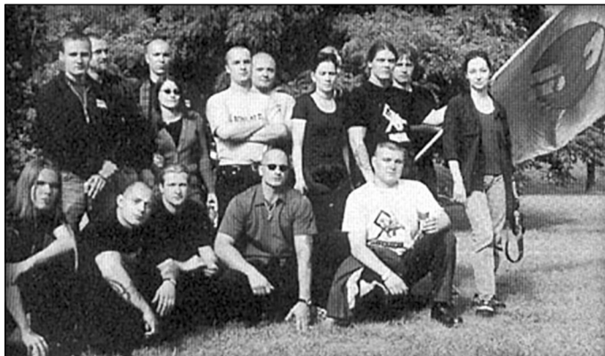
Nazi-skini z Odali w pełnej krasie