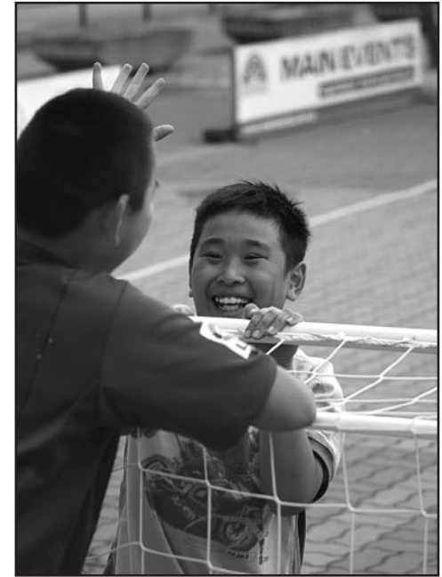
Młodzi zawodnicy podczas jednej z akcji Fundacji

Fundacja dopiero rozpoczyna swoją działalność, dlatego też niezmiernie istotna jest każda forma wsparcia. Jej organizatorzy są