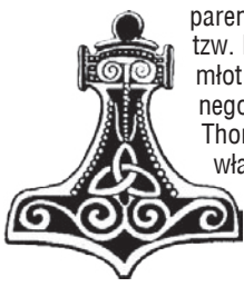
Młot Thora Mjöllnir „rasy aryjskiej”.

parencie znajdował się również tzw. Mjöllnir (staroskandynawski młot Thora) – atrybut mitologicznego boga skandynawskiego, Thora. Współcześnie jest on zawłaszczany przez neonazystów i, szczególnie, rasistów praktykujących odynizm – religię neopogańską, dla których oznacza siłę i czystość