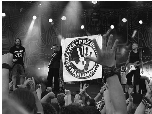
Skowyt na „Przystanku Woodstock”, 2013